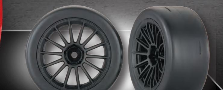
Ultra Wide Racing Slicks