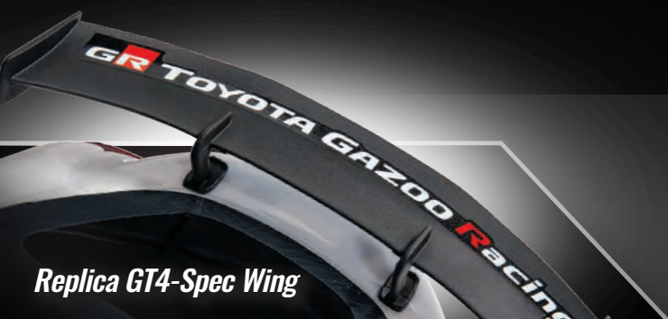
Replica GT4-Spec Wing