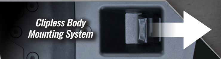
Clipless Body Mounting System